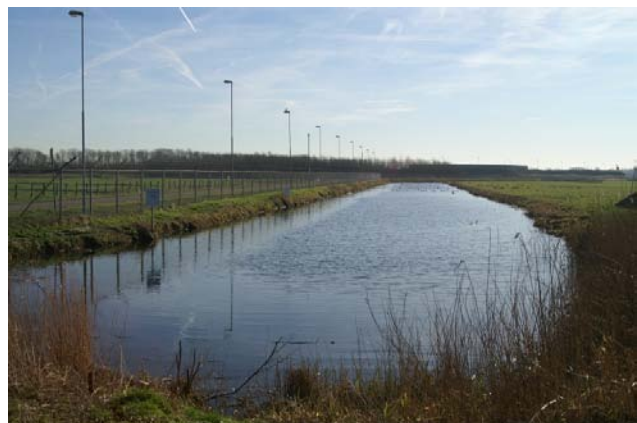
Boven: De tankgracht is een belangrijk element in de Groene Buffer ten zuiden van de Locatie Valkenburg. De tankgracht is door de gemeente Katwijk aangewezen als gemeentelijk monument.

Kijk voor meer informatie op www.locatievalkenburg.nl > De plannen > Openbare stukken.