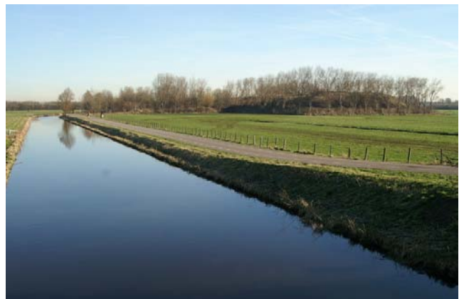
Onder: Het landbouwgebied in Wassenaar dat eveneens deel uitmaakt van de groene Buffer.